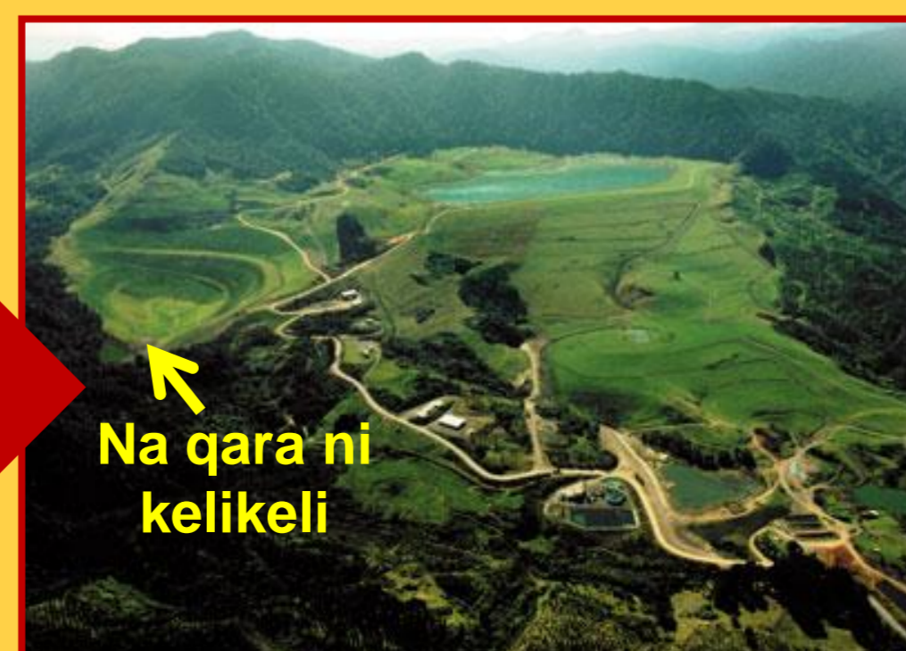
Na kena i rairai ni sa sogo na cakacaka