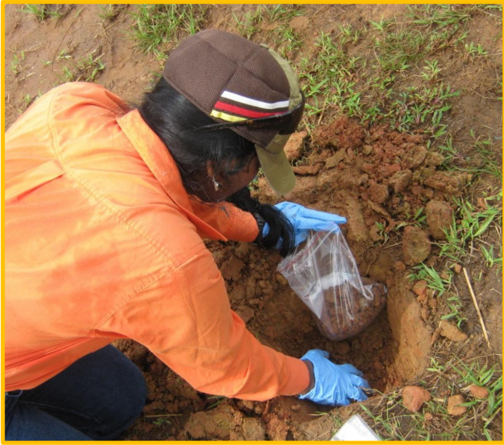
Vakadikevi na qele kei na kau e ganita

Na vakacokotaki ni vanua e tiki ni bisinisi e na gauna oqo.