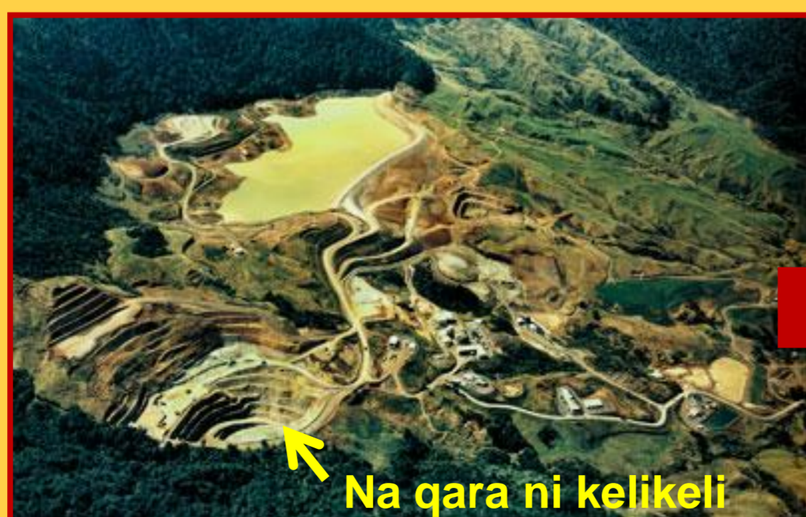
Nai vakaraitaki ni kelikeli e na gauna ni cakacaka

E na tubu tale naveikau me maroroya na qele kei veika bula